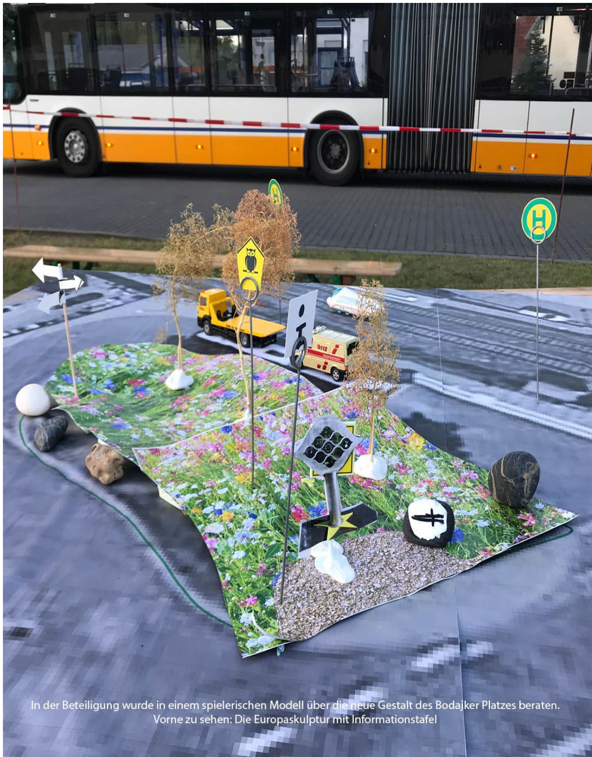
In der Beteiligung wurde in einem spielerischen Modell über die neue Gestalt des Bodajker Platzes beraten. Vorne zu sehen: Die Europaskulptur mit Informationstafel