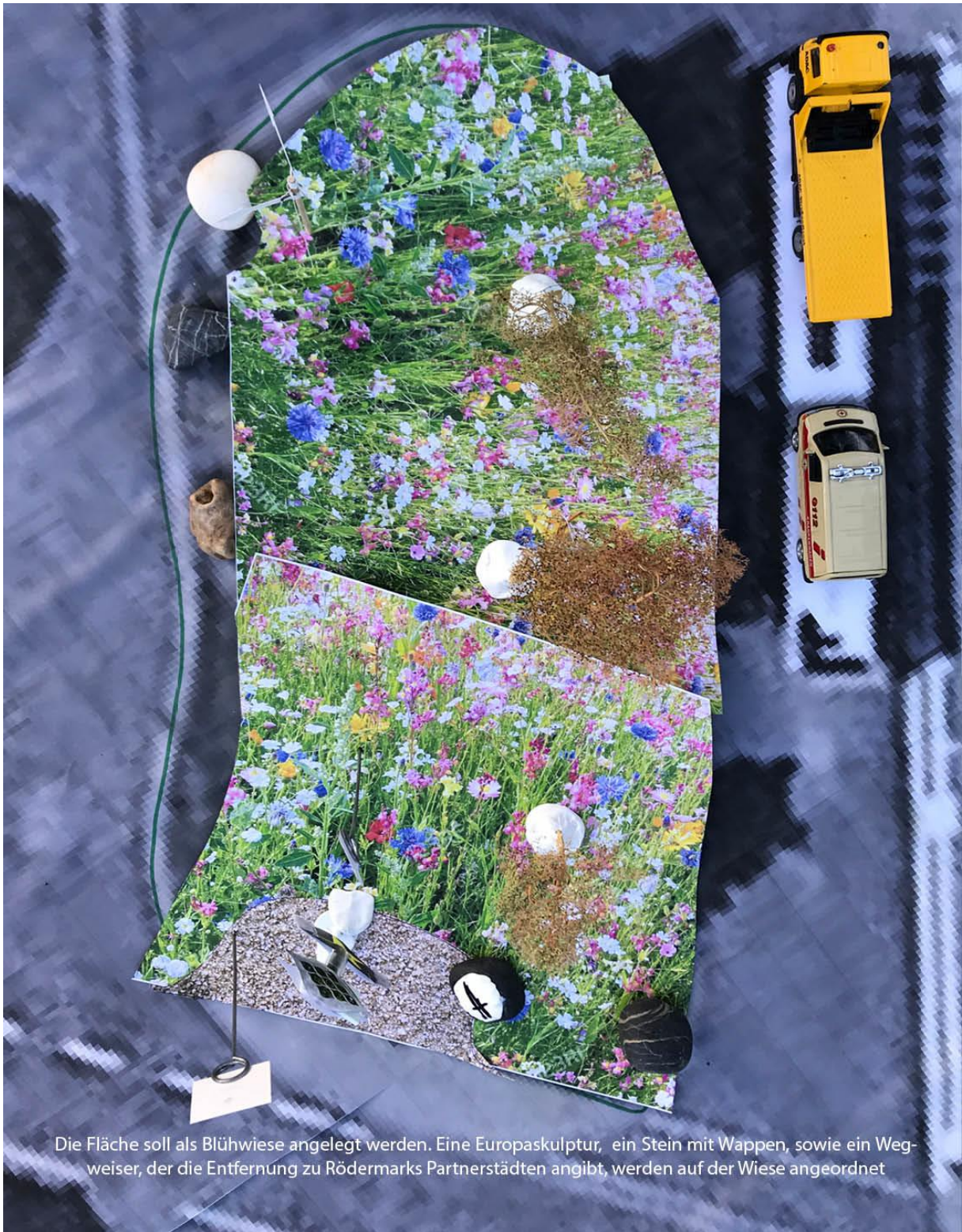
Die Fläche soll als Blühwiese angelegt werden. Eine Europaskulptur, ein Stein mit Wappen, sowie ein Wegweiser, der die Entfernung zu Rödermarks Partnerstädten angibt, werden auf der Wiese angeordnet