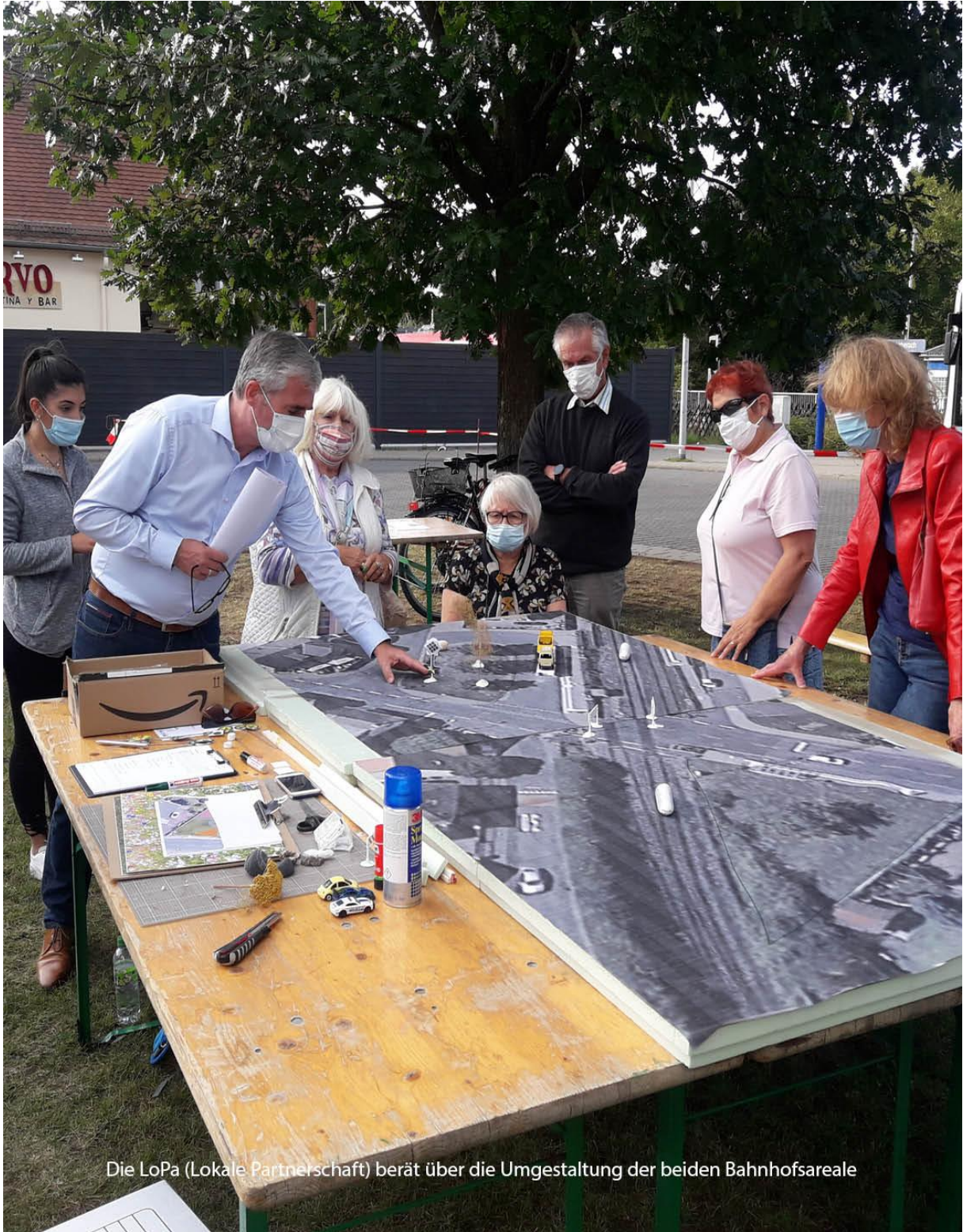
Die LoPa (Lokale Partnerschaft) berät über die Umgestaltung der beiden Bahnhofsareale