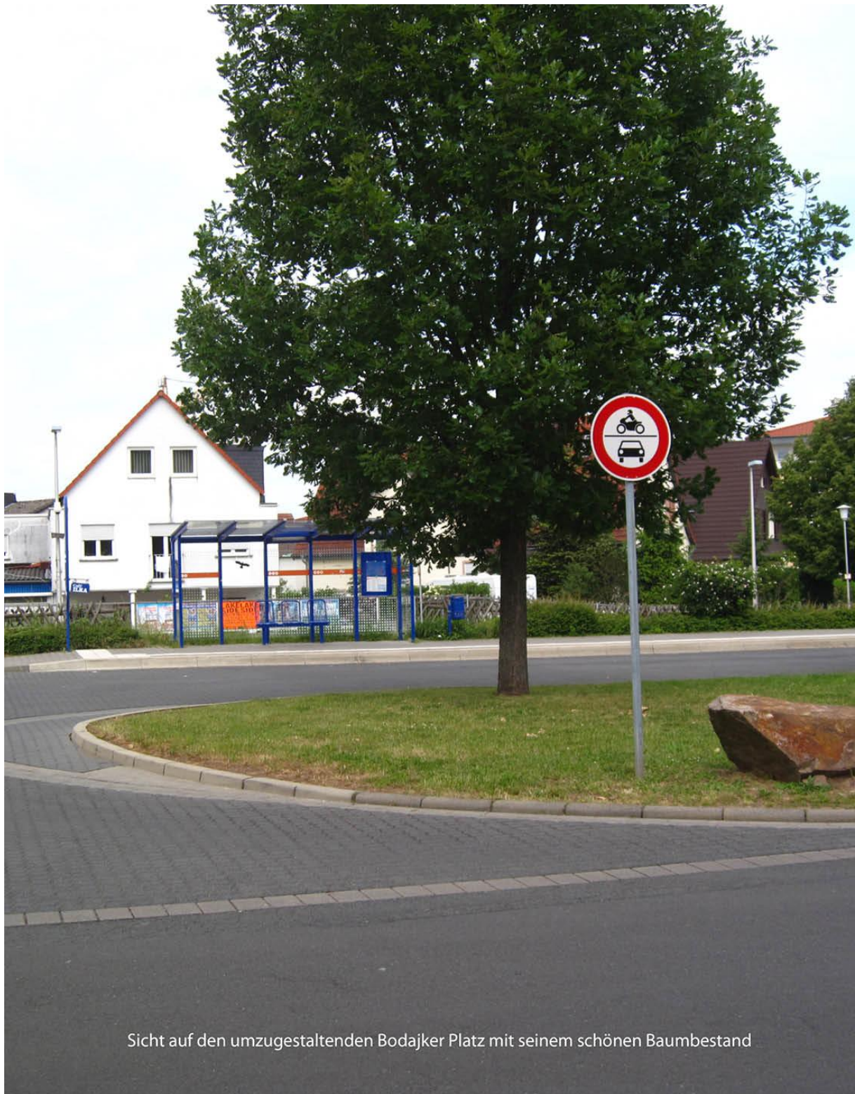
Sicht auf den umzugestaltenden Bodajker Platz mit seinem schönen Baumbestand