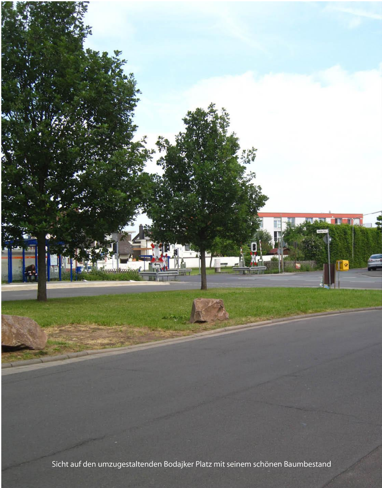
Sicht auf den umzugestaltenden Bodajker Platz mit seinem schönen Baumbestand