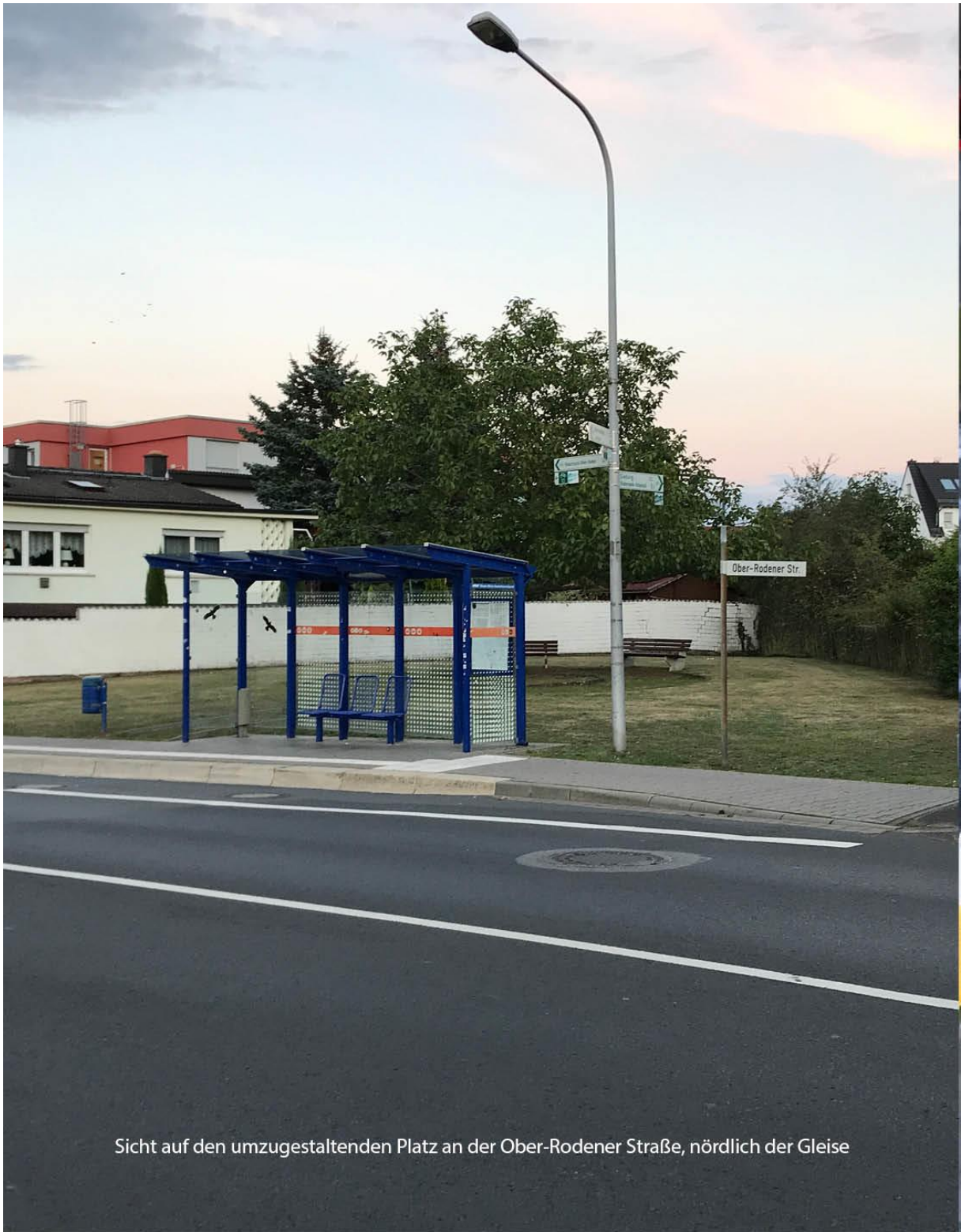
Sicht auf den umzugestaltenden Platz an der Ober-Rodener Straße, nördlich der Gleise