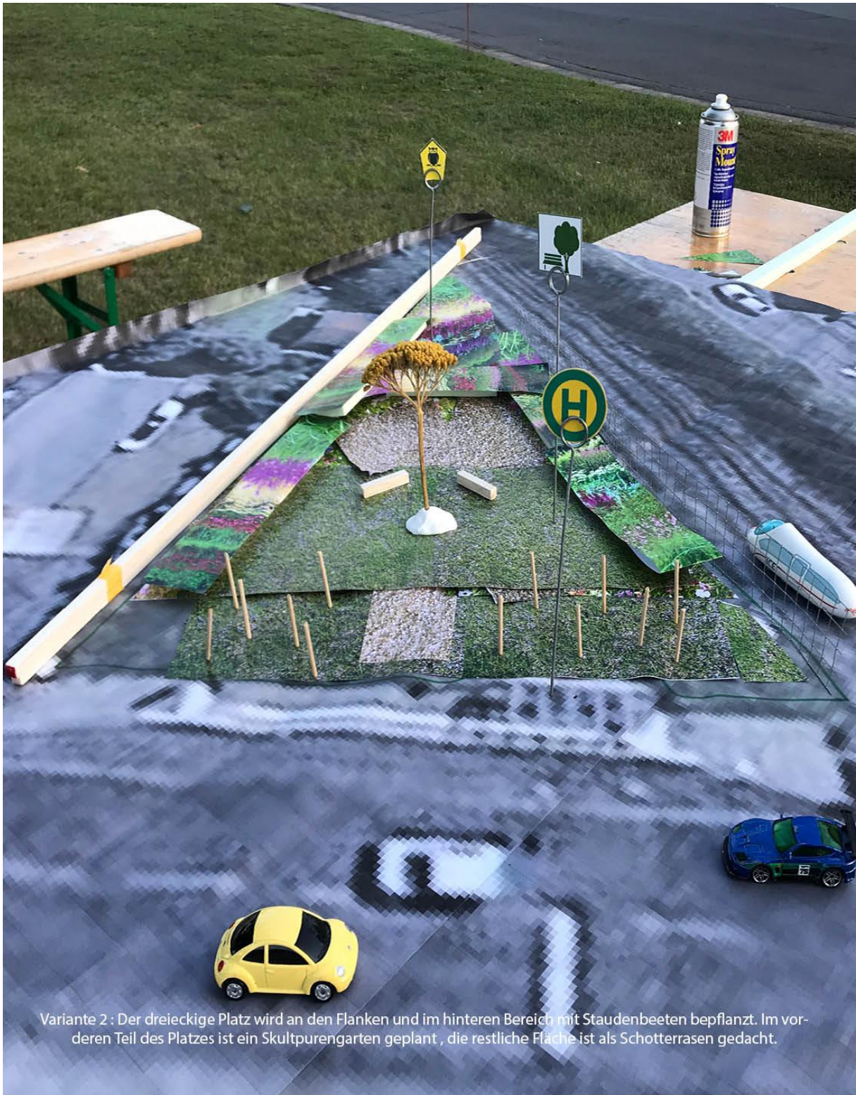
Variante 2 : Der dreieckige Platz wird an den Flanken und im hinteren Bereich mit Staudenbeeten bepflanzt. Im vorderen Teil des Platzes ist ein Skulpturengarten geplant , die restliche Fläche ist als Schotterrasen gedacht.